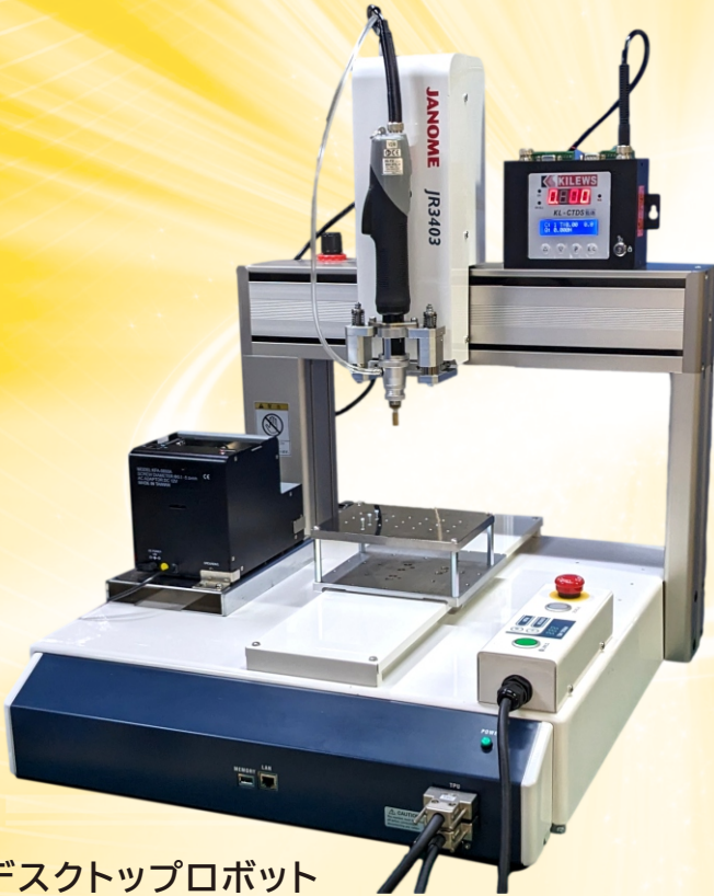
デスクトップロボット