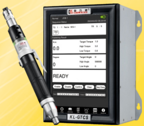
SGT-CS + KL-GTCS