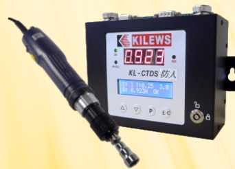
各種ドライバ + KL-CTDS