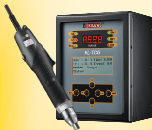
SKT-CG + KL-TCG